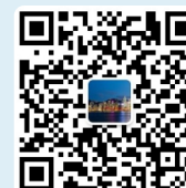
香港招商聯絡處微信公眾號